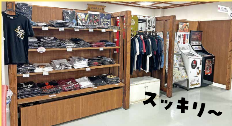
Tシャツをディスプレイできるハンガーラック付き